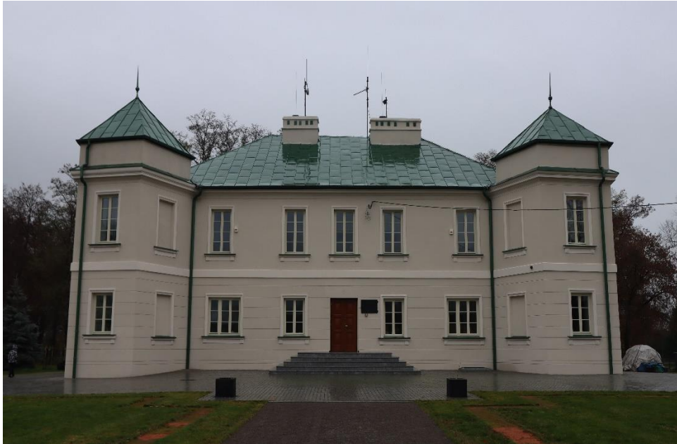
Żabików – pałac, widok na elewację frontową