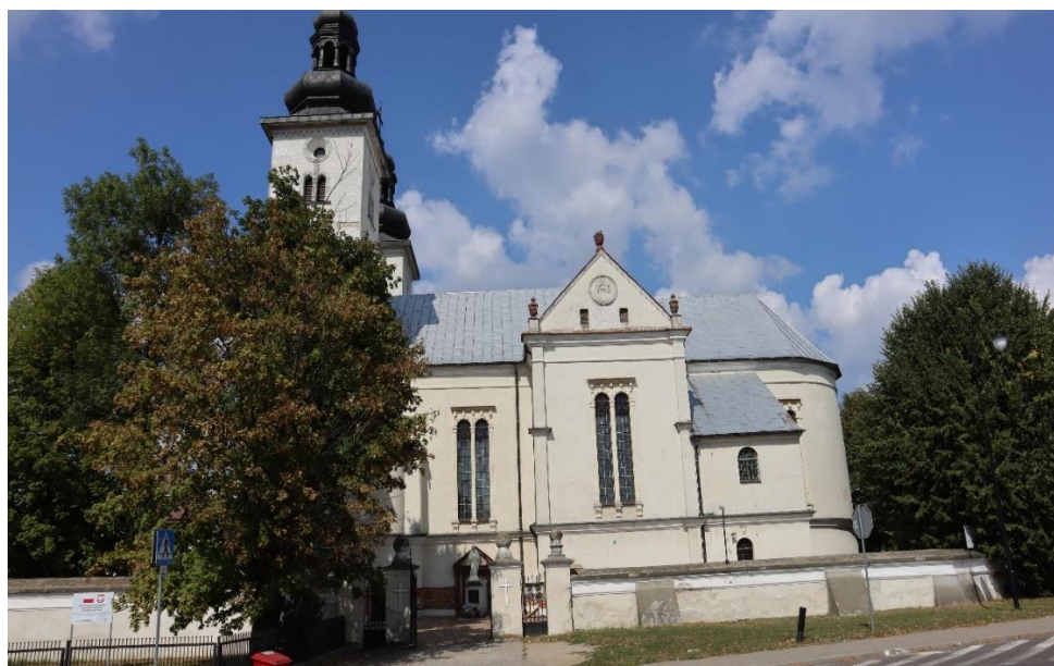
Czemierniki – kościół pw. św. Stanisława, widok od pn.-wsch.