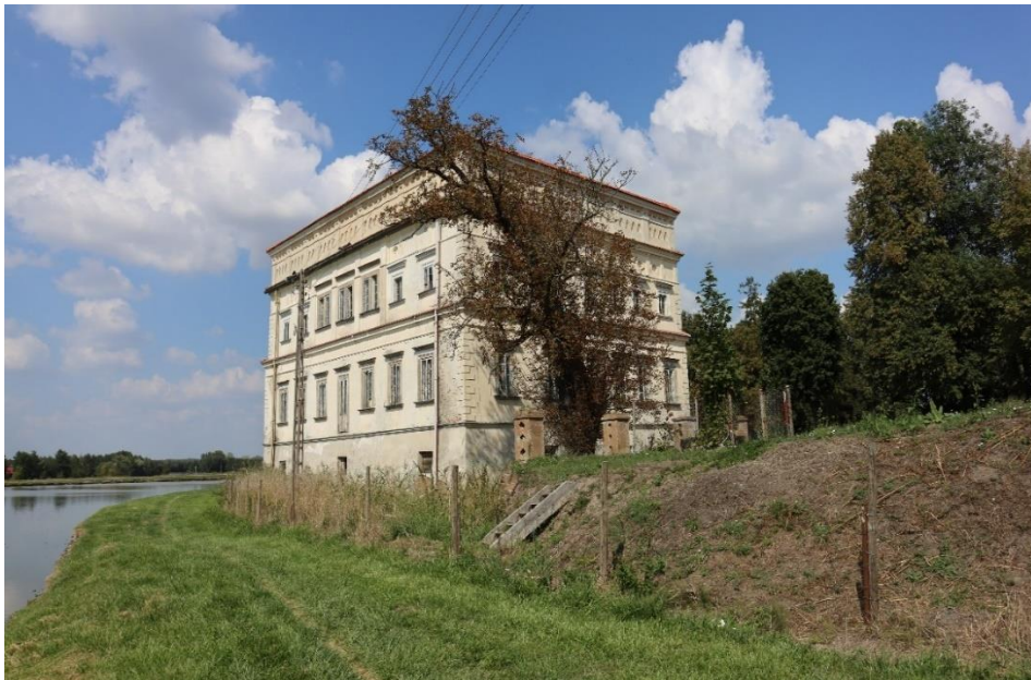
Czemierniki – pałac, widok od strony stawów