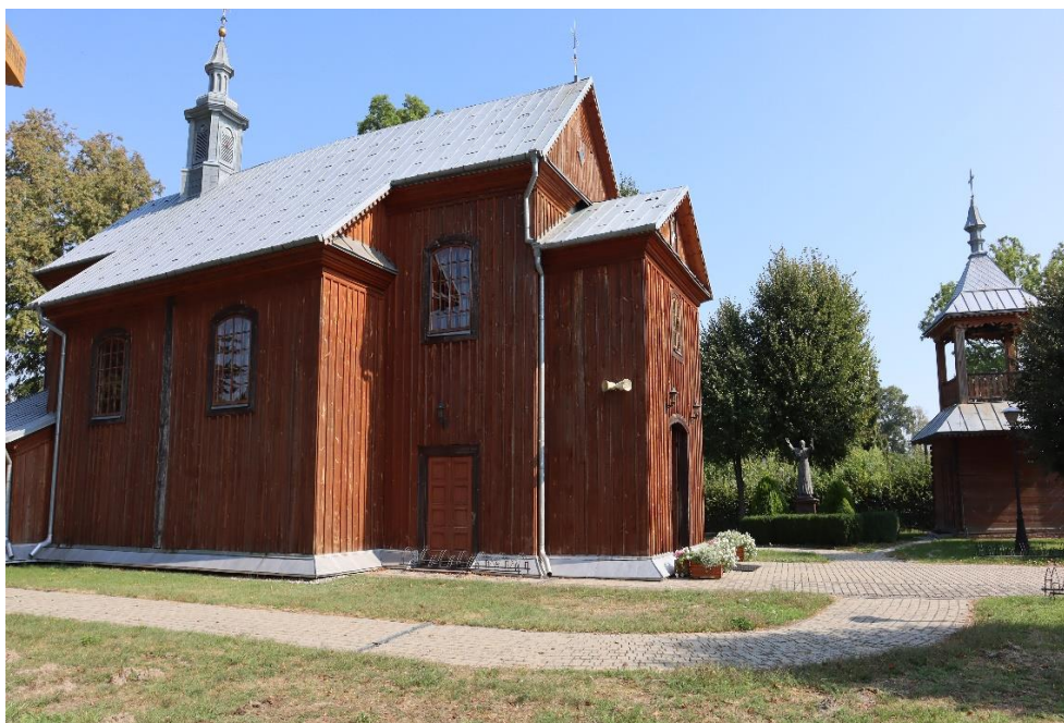
Przegaliny Duże - zespół kościelny, widok od strony pd. na kościół i dzwonnice