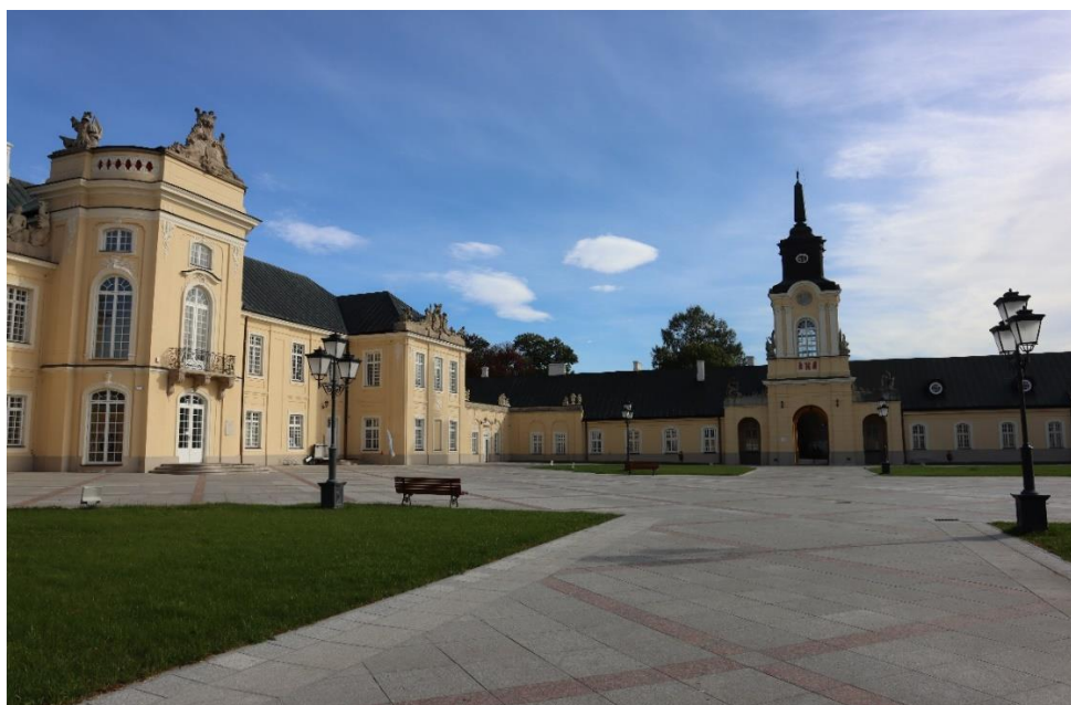
Radzyń Podlaski – zespół pałacowy, widok z dziedzińca na fasadę korpusu głównego pałacu i skrzydło wschodnie