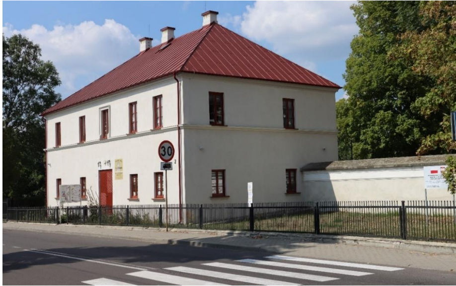
Czemierniki – Mansjonaria w zespole kościoła pw. św. Stanisława, widok od pd.-wsch.