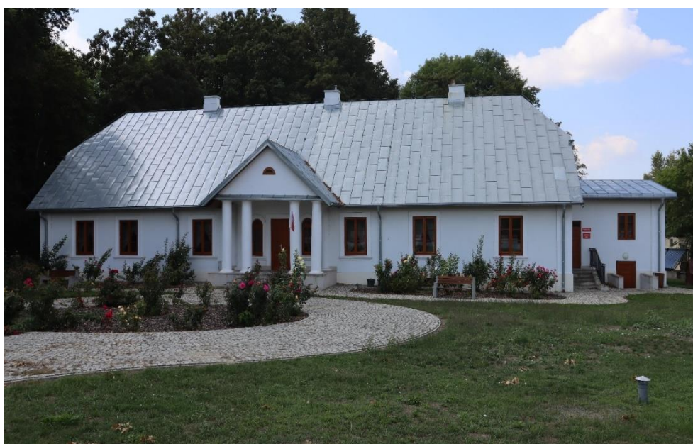
Bełcząc – dwór widok na elewację frontową