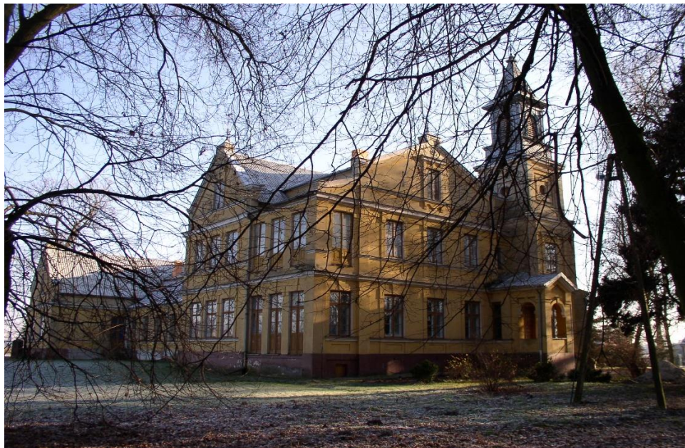
Branica Radzyńska – pałac, widok od strony parku