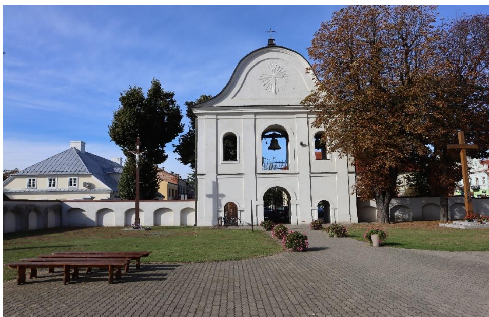
Radzyń Podlaski – dzwonnica bramowa przy kościele pw. Trójcy Świętej