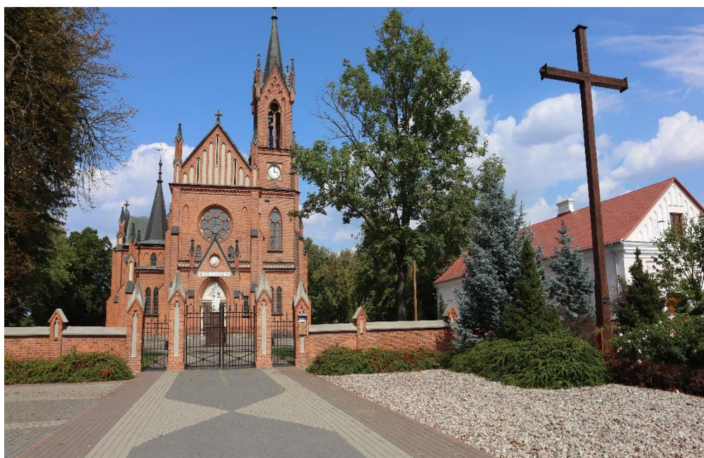
Komarówka Podlaska – zespół kościelny, widok od strony pd.