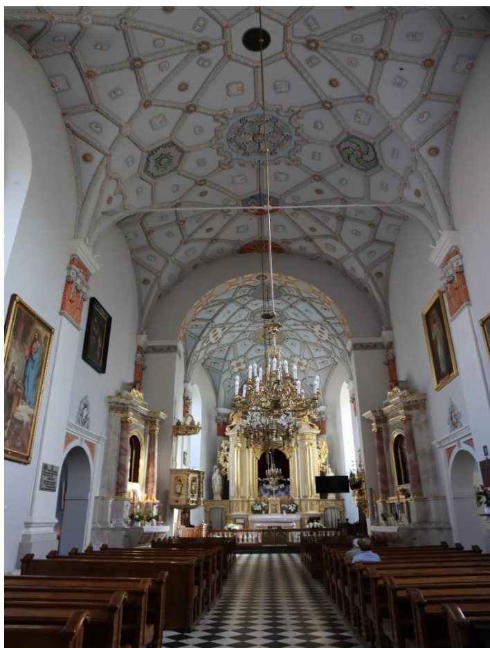
Radzyń Podlaski – wnętrze kościoła pw. Trójcy Świętej