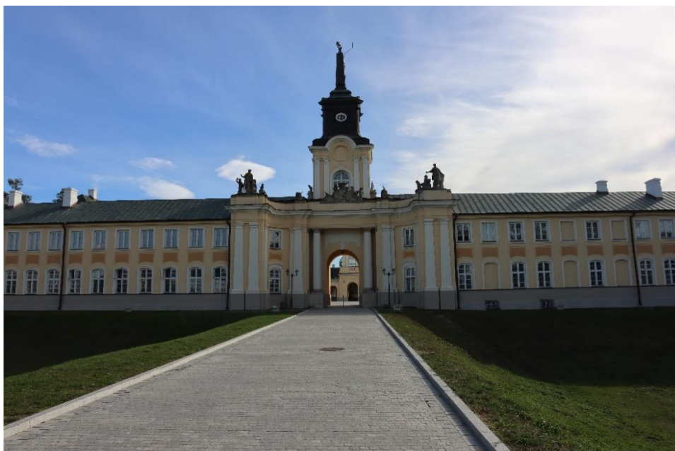
Radzyń Podlaski – zespół pałacowy, widok na skrzydło zach. od strony miasta